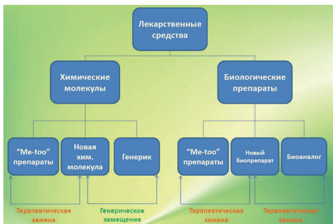
Рис. 3. Терапевтические эквиваленты лекарственных средств

FDA признает терапевтически эквивалентными препараты только в том случае, если они удовлетворяют следующим критериям: