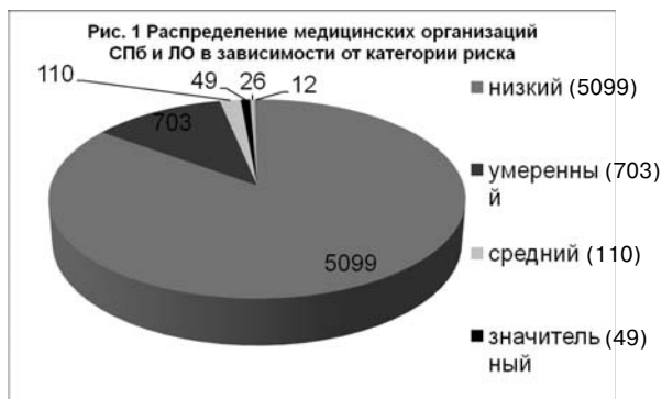
Рис.1. Распределение медицинских организаций Санкт-Петербурга и Ленинградской области в зависимости от категории риска.

дивидуальных предпринимателей при осуществлении государственного контроля (надзора) и муниципального контроля” (статья 8.2.), в том числе, о выдаче предостережений.