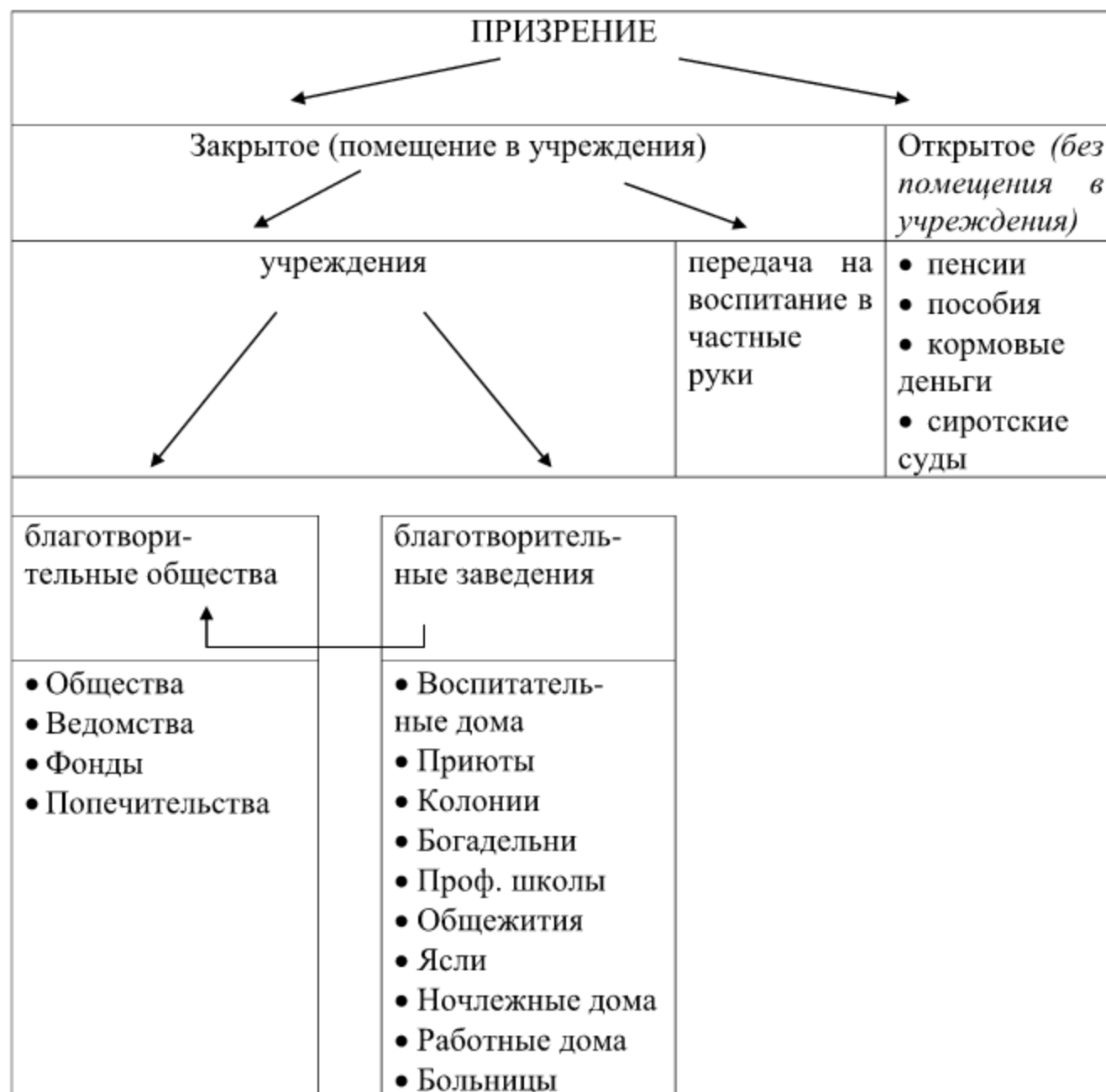
Схема № 1. Виды призрения в России в период с IX по н. XX вв.

передача на воспитание в частные руки и развитие сети специализированных учреждений: благотворительных обществ (обществ, ведомств, фондов, попечительств) и благотворительных заведений (воспитательных домов, приютов, богаделен, яслей, больниц и др.). При этом благотворительные заведения могли функционировать как самостоятельно, так и в составе обществ.