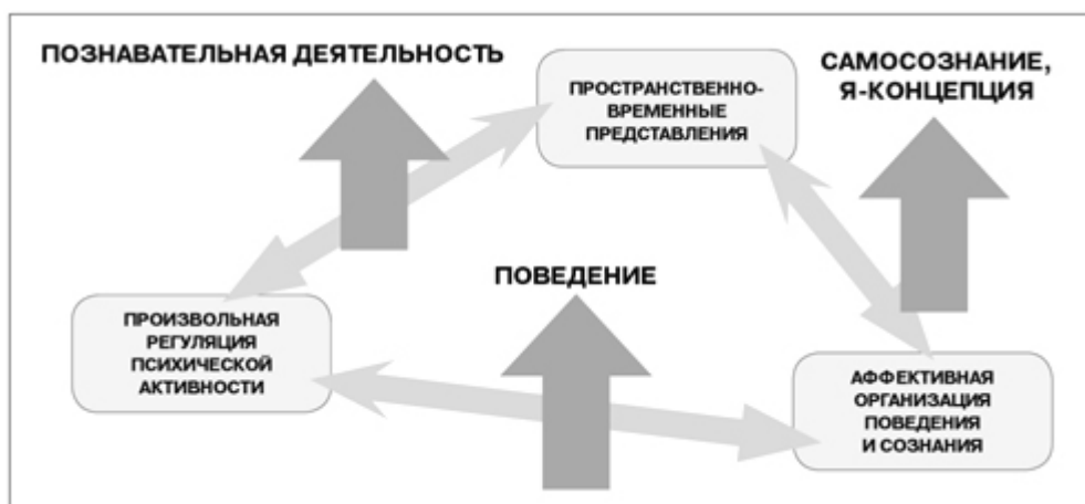
Рис. 2. Треугольник взаимодействия базовых составляющих развития как основных компонентов регуляторно-волевой, когнитивной и аффективно-эмоциональной сфер

При этом обязательно включение в познавательную деятельность системы аффективной регуляции, как ее мотивационно-аффективного компонента. Произвольную регуляцию и пространственные представления все же следует рассматривать как приоритетные для познавательной деятельности ребенка.