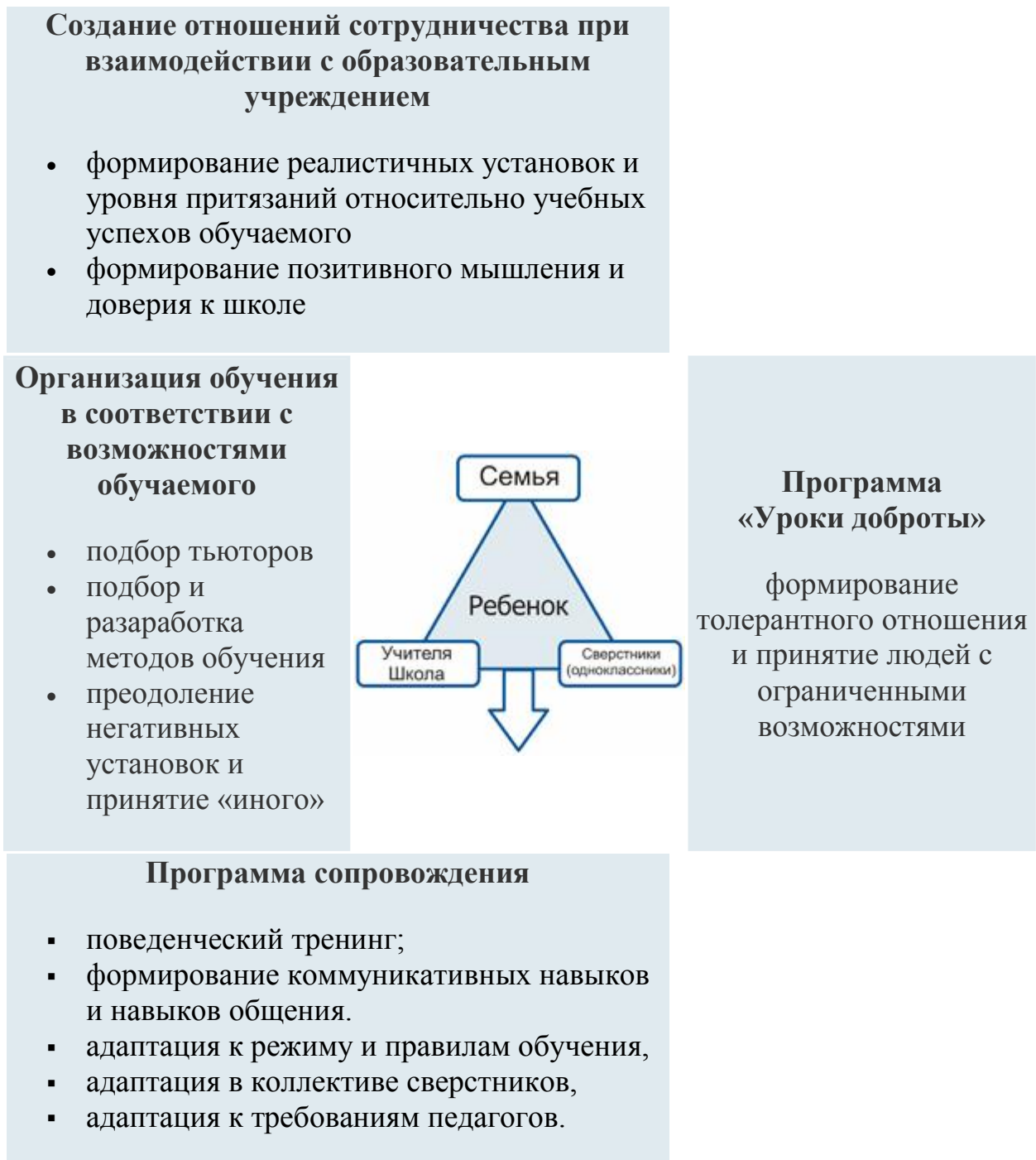
Рис. 3. Схема модульного сопровождения лиц с ОВЗ.

При реализации указанных программ применяются различные стратегии и методы психологической помощи: диагностика, консультирование, тренинг. Кроме этого используются: