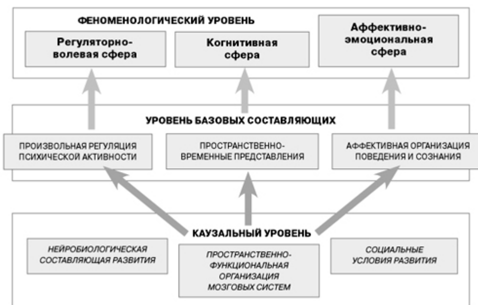
Рис 1. Трехкомпонентная модель анализа психического развития

Каузальный уровень рассматривается как состоящий: