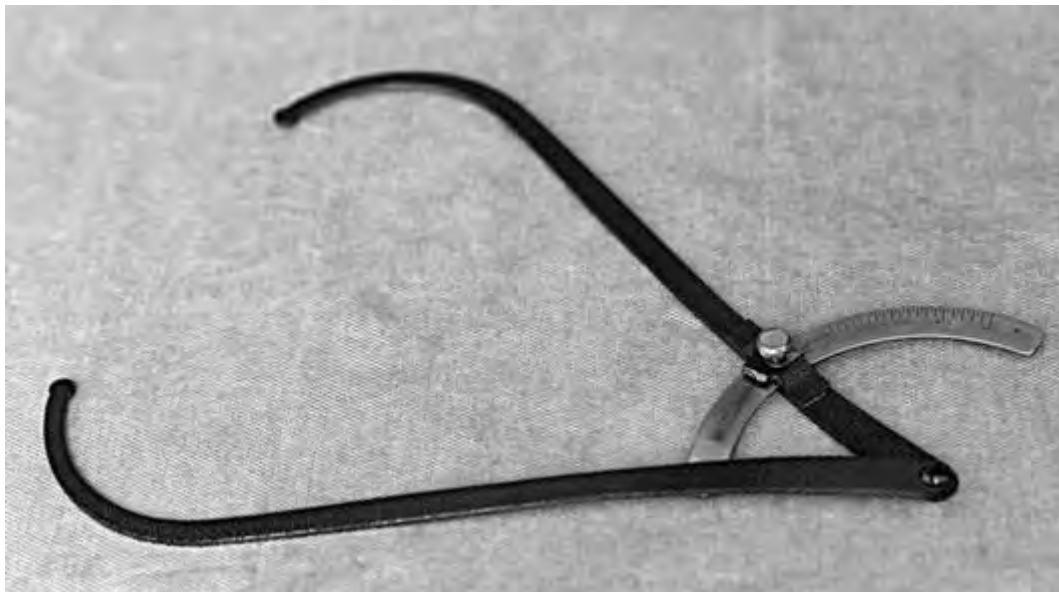
Рис. 10. Тазомер Мартина

результат измерения будет завышен. Также при проведении пельвиометрии необходимо следить за симметричностью положения ножек тазомера (рис. 14).