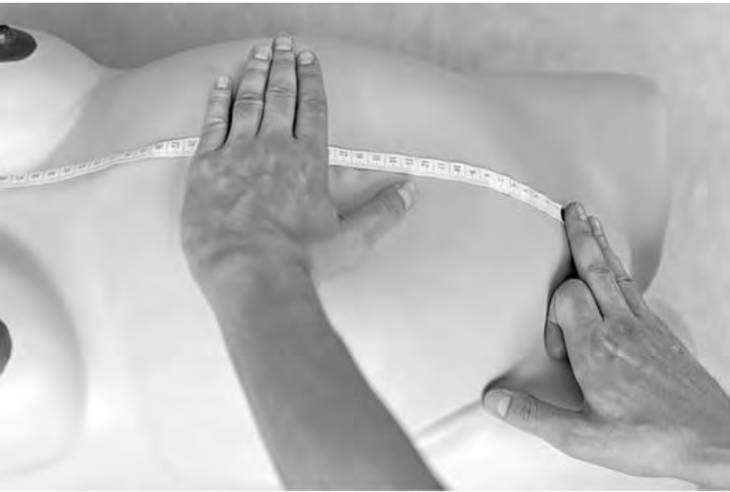
Рис. 6. Скольжение рукой по овиду беременной матки с целью прижатия сантиметровой ленты к животу