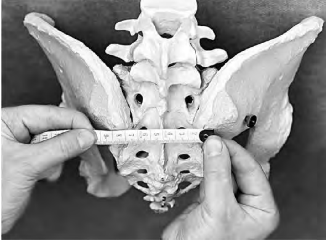
Рис. 26. Измерение горизонтального размера ромба Михаэлиса сантиметровой лентой на примере костного таза

У женщин с нормальными размерами таза форма его приближается к квадрату, все стороны которого равны, а углы приблизительно составляют 90^\circ . Такая форма ромба интерпретируется как правильная . Уменьшение вертикальной или поперечной оси ромба, асимметрия его половин (верхней и нижней, правой и левой) свидетельствуют об аномалиях костного таза. Длинник ромба (вертикальная его диагональ) в нормальном тазу должен быть не меньше 11 см. Поперечная диагональ (расстояние между правой и левой подвздошной остью) в норме равна 10-11 см. Поперечная диагональ делит такой правильный ромб на два одинаковых по величине треугольника, сложенных своими основаниями друг к другу. При узких тазах формируются другие формы ромба. Так, при поперечно-суженном тазе вследствие сужения поперечника ромба последний весь ( in toto ) вытягивается в длину в сторону вертикальной диагонали, в результате чего верхний и нижний углы его становятся острыми, а боковые, наоборот, тупыми. При плоских тазах существуют обратные отношения: боковые углы ромба острые, а верхний и нижний - тупые. Помимо этого, в таких тазах ясно выступает разница в размерах обоих треугольников (уменьшен верхний треугольник). При резко деформированных рахитических тазах верхний угол до отказа сближается с основанием верхнего треугольника.