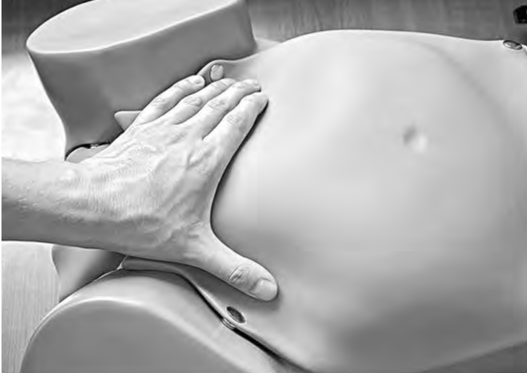
Рис. 31. Третий прием Леопольда-Левицкого. Определение предлежащей части и отношение ее ко входу в малый таз

Четвертым приемом Леопольда-Левицкого определяют характер предлежащей части и ее местоположение по отношению к плоскостям малого таза. Для выполнения данного приема врач поворачивается лицом к ногам обследуемой женщины. Кисти рук располагают латерально от средней линии над горизонтальными ветвями лобковых костей. Постепенно продвигая руки между предлежащей частью и плоскостью входа в малый таз, определяют характер предлежащей части (что предлежит) и ее местонахождение (рис. 32). Головка может быть подвижной, прижатой ко входу в малый таз или фиксированной малым или большим сегментом.