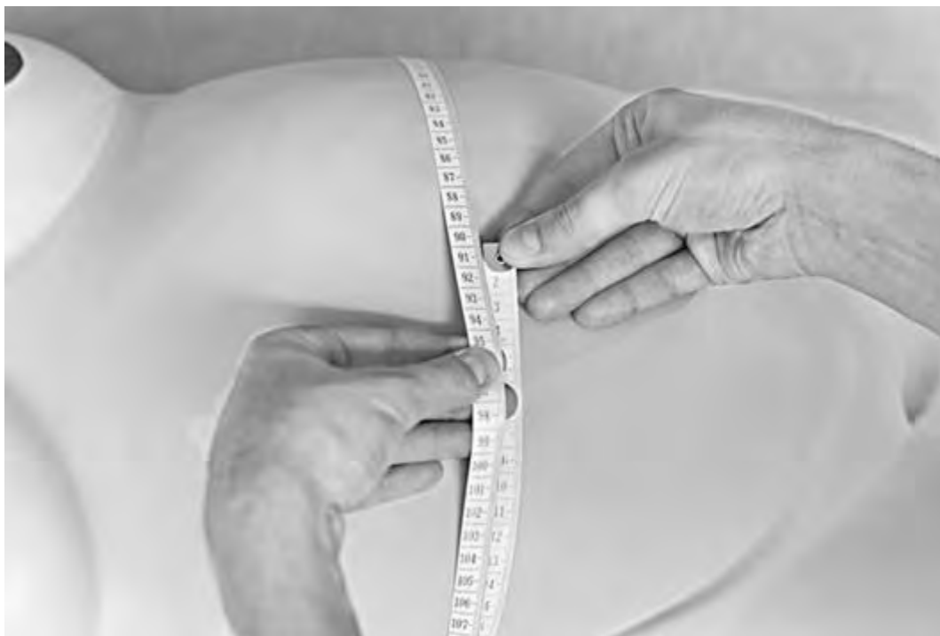
Рис. 2. Натяжение сантиметровой ленты

Рис. 1. Расположение сантиметровой ленты на уровне пупка для измерения окружности живота