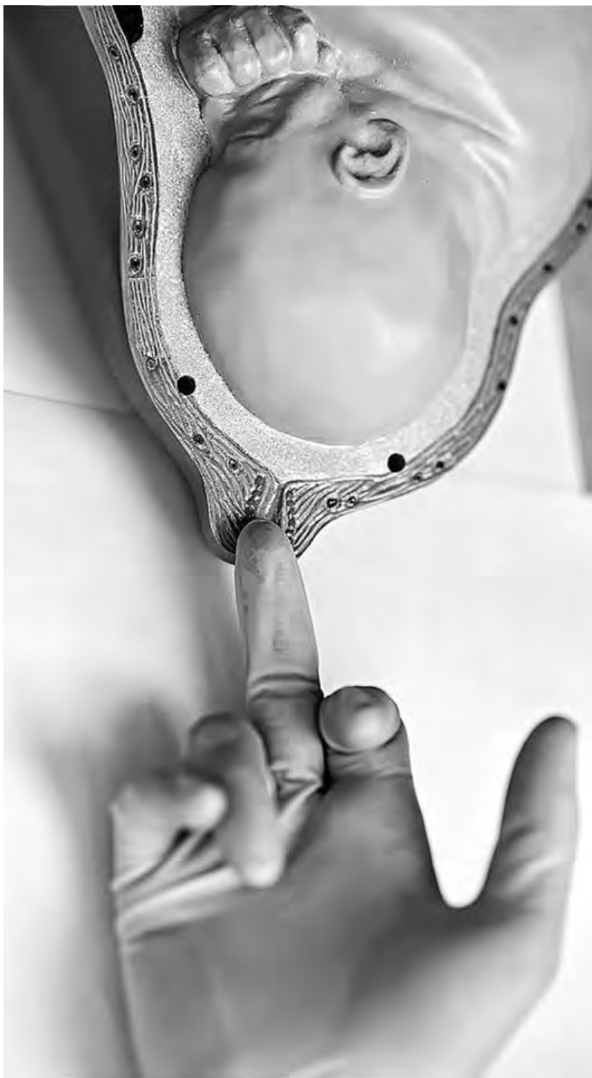
Рис. 43. Определение консистенции шейки матки и проходимости цервикального канала. Наружный зев пропускает кончик пальца

Пример формулировки состояния шейки матки: шейка матки расположена по проводной оси малого таза, длиной до 2 см, мягкой консистенции; цервикальный канал свободно проходим для двух пальцев.