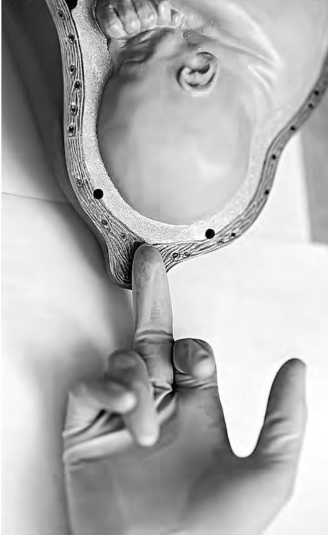
Рис. 44. Определение консистенции шейки матки и проходимости цервикального канала. Цервикальный канал проходим до области внутреннего зева