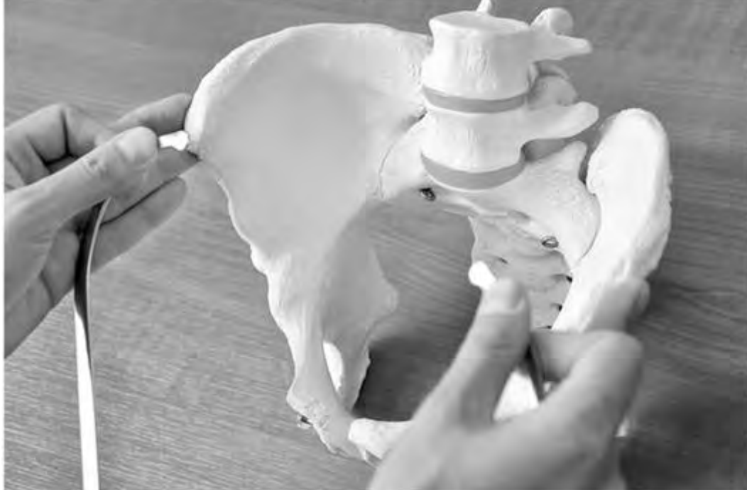
Рис. 12. Пальпация костных ориентиров. Акушер III и IV пальцами обеих рук (средним и безымянным) определяет костные ориентиры, не выпуская при этом тазомер из рук