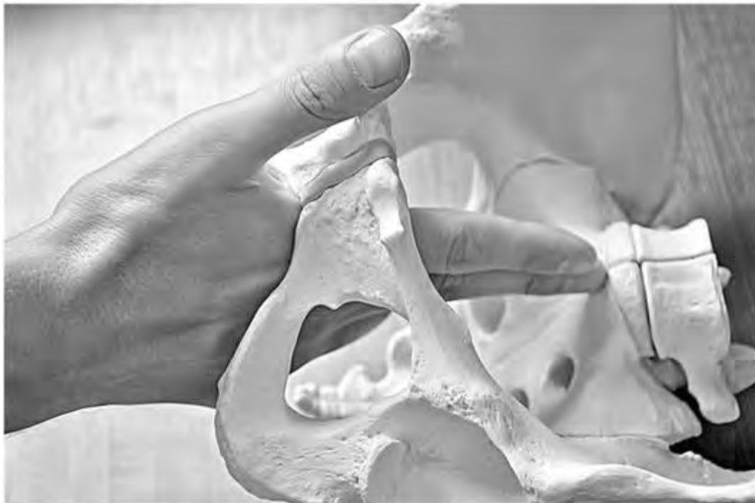
Рис. 19. Внутренняя пельвиометрия. Определение диагональной конъюгаты: достижение мыса крестца при влагалищном исследовании