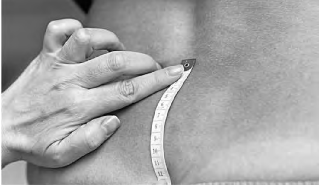
Рис. 24. Измерение вертикали ромба Михаэлиса сантиметровой лентой

Для измерения и оценки формы ромба необходимо светлое помещение. Женщина должна находиться в положении стоя. Латеральные углы ромба хорошо контурируются в виде небольших округлых углублений непосредственно над задневерхними остями подвздошных костей. Верхний угол ромба соответствует углублению между остистыми отростками последнего поясничного и I крестцового позвонков, называемому надкрестцовой ямкой (рис. 35-36). Ромб не у всех хорошо выражен, поэтому для нахождения надкрестцовой ямки пользуются таким приемом: проводят горизонтальную линию, соединяющую верхние края гребней подвздошных костей ( crista ossis ilei ) обеих сторон; точка по средней линии, расположенная ниже проведенной линии на два поперечных пальца, и будет надкрестцовой ямкой. Нижний угол ромба - верхушка крестца - примерно соответствует началу ягодичной складки и легко определяется пальпаторно как наиболее выступающая кзади нижняя часть крестца. Измерения проводят либо тазомером, либо сантиметровой лентой (рис. 25-27).