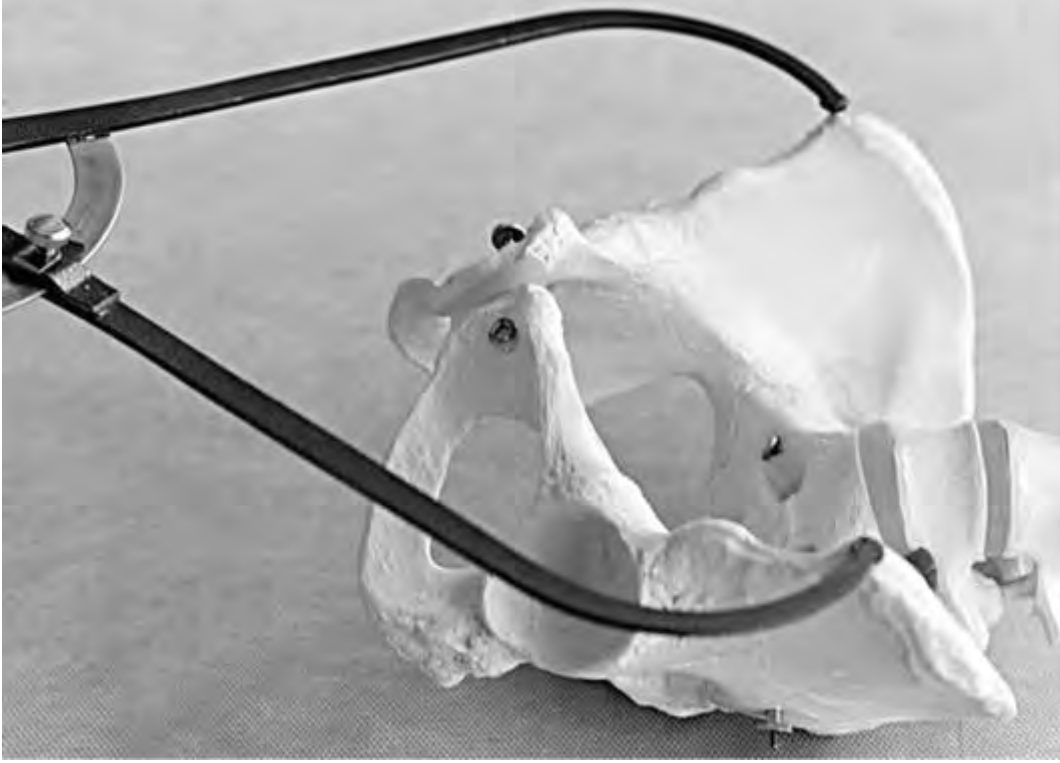
Рис. 15. Измерение distantia spinarum - расстояния между передневерхними осями подвздошных костей

Distantia cristarum - расстояние между наиболее отдаленными участками гребней подвздошных костей; этот размер равен 28-29 см (рис. 16).