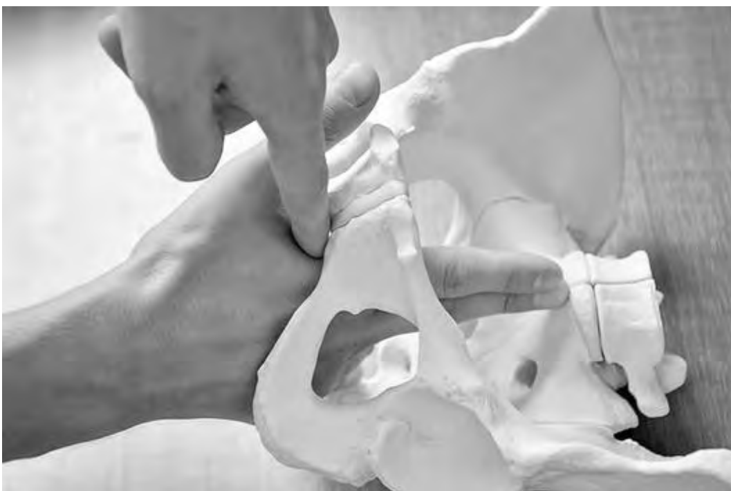
Рис. 20. Внутренняя пельвиометрия. Фиксация места соприкосновения правой руки с нижним краем симфиза