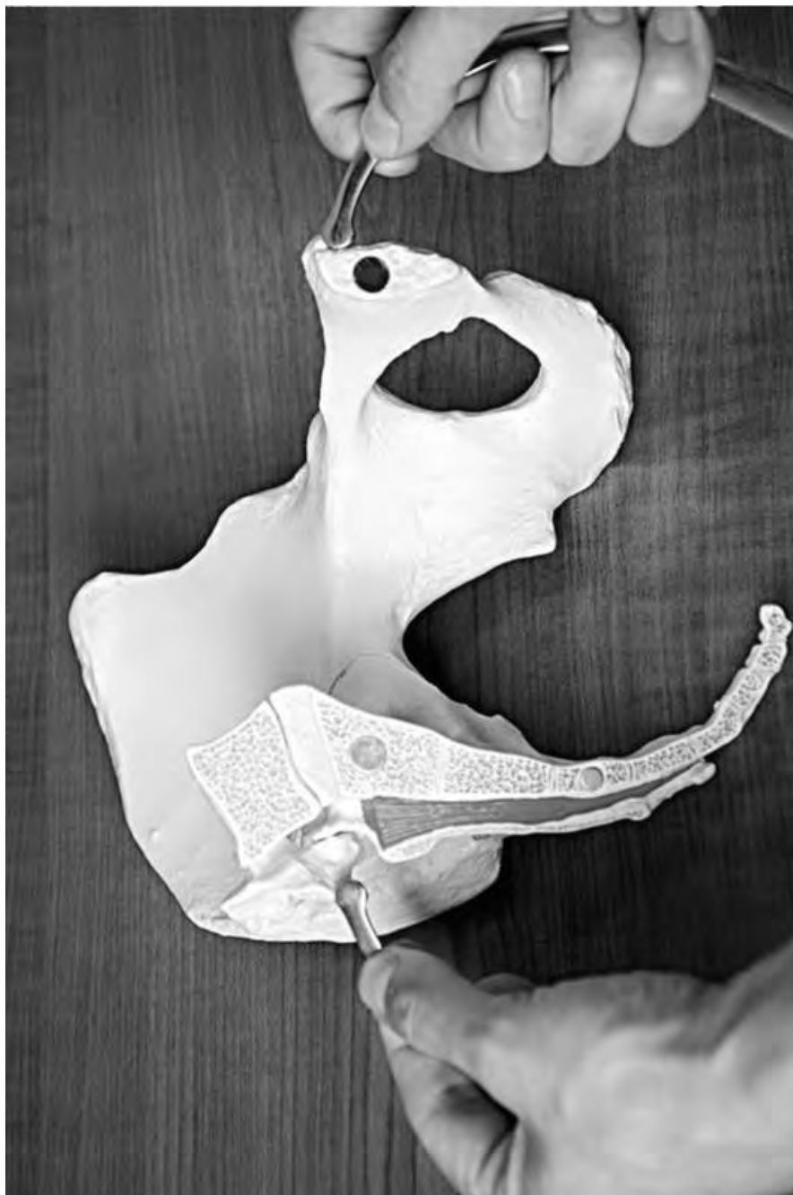
Рис. 18. Определение наружной конъюгаты

Conjugata externa (диаметр Боделока) - расстояние между серединой верхненаружного края симфиза и сочленением V поясничного и I крестцового позвонков (рис. 18). Наружная конъюгата в норме равна 20-21 см. По ней наиболее точно можно судить о размерах истинной конъюгаты (прямого размера плоскости входа в малый таз). При измерении наружной конъюгаты одну ножку тазомера ставят в надкрестцовую ямку, верхний угол ромба Михаэлиса; вторую ножку - на середину верхненаружного края симфиза. При этом не нужно забывать о небольшом надавливании на ножки тазомера, чтобы нивелировать толщину подлежащих мягких тканей.