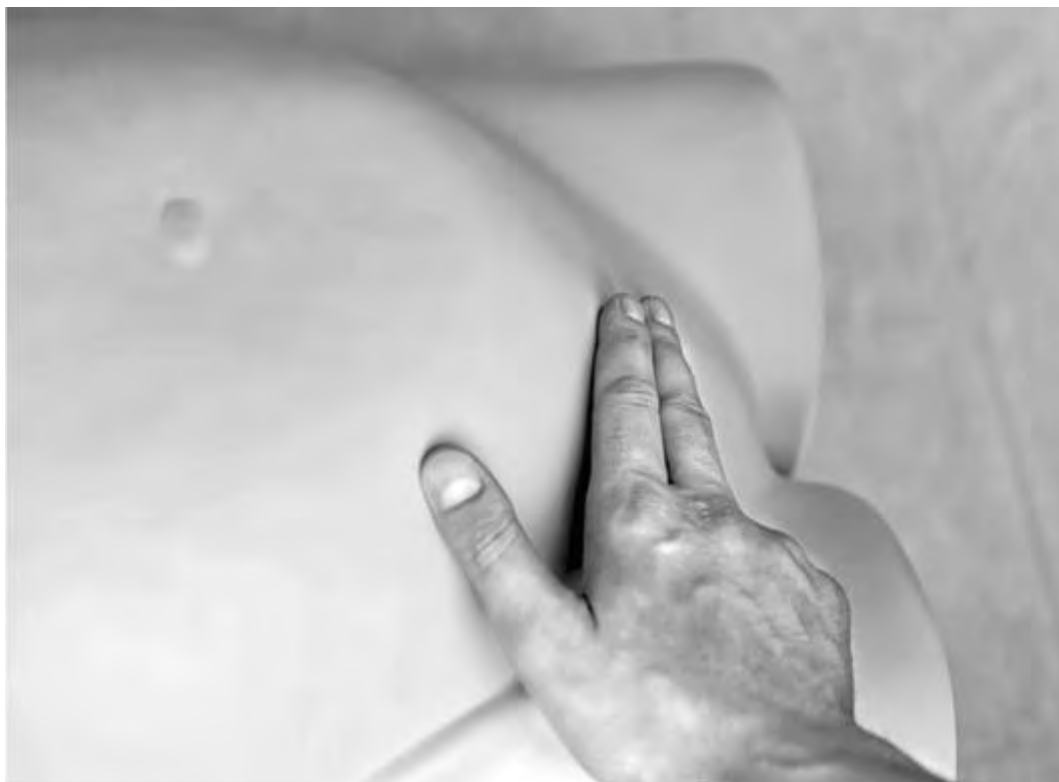
Рис. 4. Пальпаторное определение верхненаружного края симфиза

под ладонью вашей левой руки (рис. 7). Осторожно нажмите левой рукой на дно матки, тем самым прижимая плод ко входу в малый таз. Откиньте ладонь так, чтобы тыл кисти оказался книзу (рис. 8). Непосредственно под ребром левой ладони, которая прижимала сантиметровую ленту, определите цифру, соответствующую ВДМ над лобком (рис. 9). Запомните или запишите ее. Сделайте отметки в соответствующей медицинской документации. По величине окружности живота и ВДМ можно судить о соответствии беременной матки сроку беременности, также получаемые данные необходимы для расчета предполагаемой массы плода.