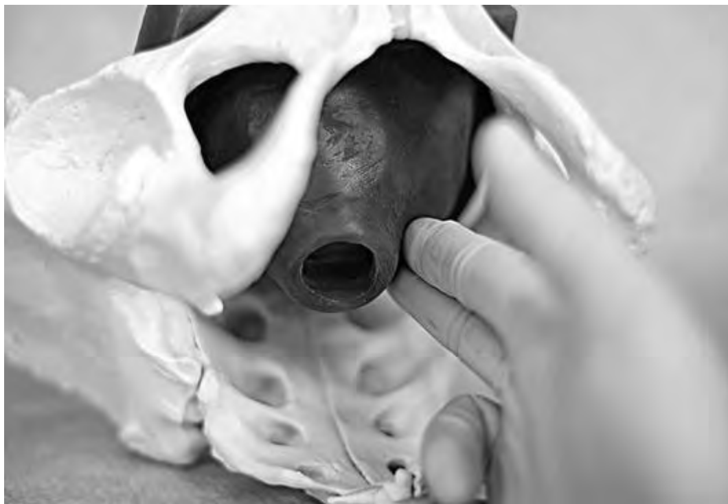
Рис. 40. Определение длины влагалищной порции шейки матки и отношения ее к проводной оси малого таза при размягченной шейке матки

Длину шейки матки оценивают пальпаторно. После введения пальцев во влагалище необходимо достичь нижнего сегмента матки под предлежащей частью плода, после чего следует подушечкой указательного или среднего пальца пропальпировать с латеральной стороны шейку матки (рис. 41). По отношению ее длины к длине ногтевой фаланги можно с определенной точностью сказать о длине шейки матки. Длину указывают в сантиметрах. Для этого перед началом исследования рекомендуют измерить длину собственной ногтевой фаланги среднего и указательного пальца правой руки. Обычно они равны и составляют около 2,5-3,0 см.