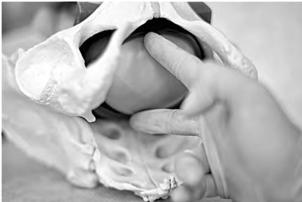
Рис. 45. Пальпаторное определение степени открытия маточного зева

Степень открытия маточного зева определяется стереометрически - по степени свободного разведения указательного и среднего пальцев в пределах кольца маточного зева (рис. 45). Края маточного зева описывают в зависимости от их толщины и податливости на растяжение. При толщине краев маточного зева менее 1 см их определяют как тонкие; в случае их толщины более 1 см - как толстые. Растяжимость оценивают по эластичности и податливости кольца маточного зева.