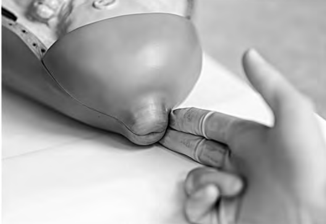
Рис. 41. Определение длины шейки матки на модели сохраненной плотной шейки матки

Консистенцию шейки матки также оценивают пальпаторно. Принято различать размягченную шейку матки, частично размягченную и плотную. От консистенции шейки матки напрямую зависит проходимость цервикального канала.