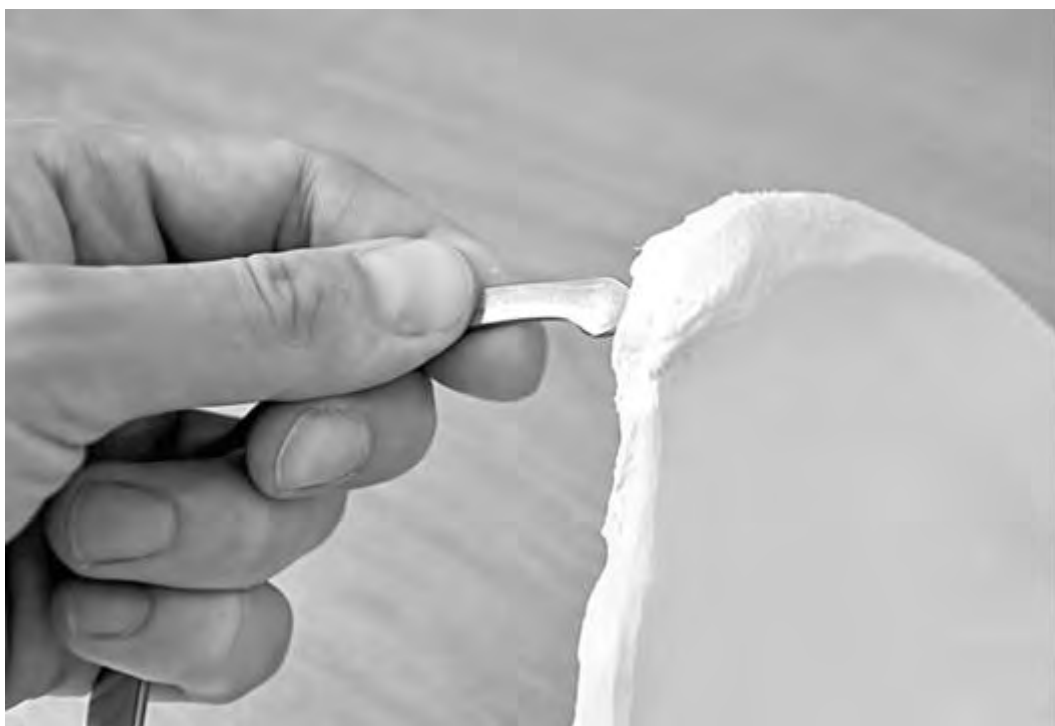
Рис. 13. Установка ножек тазомера на костный ориентир таза