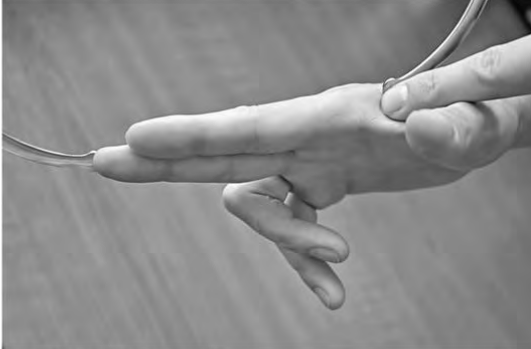
Рис. 21. Внутренняя пельвиометрия. Измерение тазомером расстояния между верхушкой среднего пальца и местом отметки на правой руке