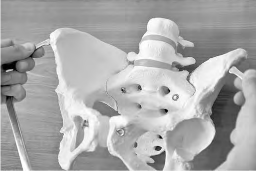
Рис. 14. При измерении таза необходимо следить за симметричностью положения ножек тазомера

Измерение таза производят, как было указано выше, тазомером. Только некоторые измерения (выхода таза, distantia Tridondani и ряд дополнительных) можно производить сантиметровой лентой. Основная задача пельвиометрии - косвенно получить представления о размерах малого таза.