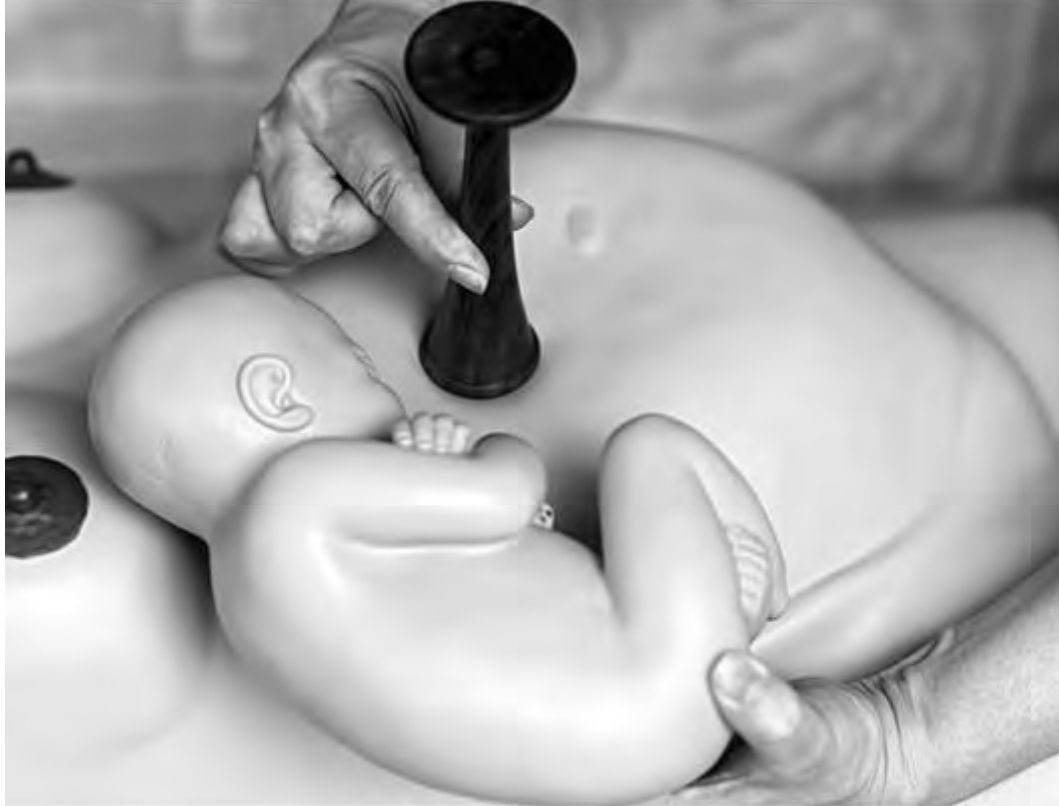
Рис. 36. Место наилучшего выслушивания сердцебиения плода при тазовом предлежании, второй позиции, переднем виде

При первой позиции плода сердцебиение лучше всего выслушивается слева, при второй - справа. При головных предлежаниях сердцебиение плода наиболее четко прослушивается ниже пупка, при тазовых предлежаниях - выше пупка. В родах, по мере опускания предлежащей части и постепенного поворота спинки вперед, меняется место наилучшей слышимости сердцебиения плода. Если головка плода находится в полости малого таза или на тазовом дне, сердцебиение плода выслушивается над лобком. При поперечных положениях плода сердцебиение обычно выслушивается ниже пупка или на его уровне.