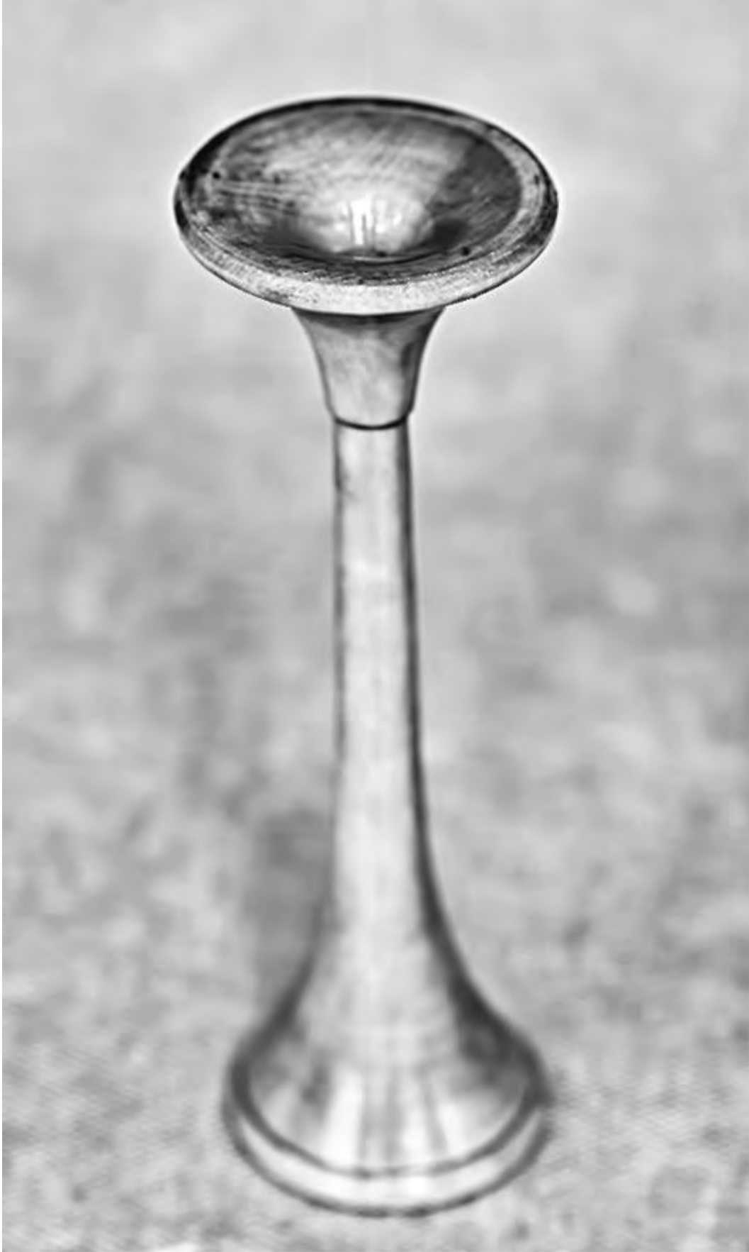
Рис. 33. Акушерский стетоскоп

Место, где выслушивается сердцебиение, зависит от положения, позиции, вида и предлежания плода (рис. 34-37). Отчетливее всего сердцебиение плода выслушивается со стороны спинки.