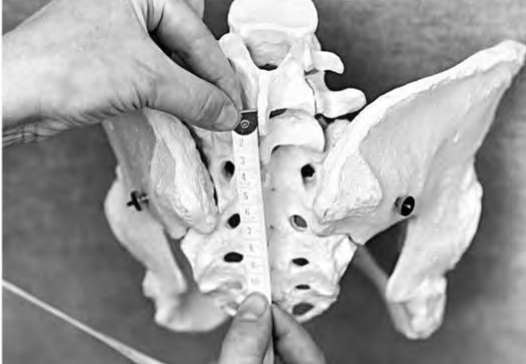
Рис. 27. Измерение вертикального размера ромба Михаэлиса сантиметровой лентой на примере костного таза

Distantia Tridondani (размер Тридондани) соответствует длиннику (вертикали) ромба Михаэлиса. По данному размеру можно судить о величине истинной конъюгаты. Профессор Г.Г. Гентер подтвердил параллельность между степенью укорочения истинной конъюгаты и размером Тридондани. В норме distantia Tridondani составляет 11 см.