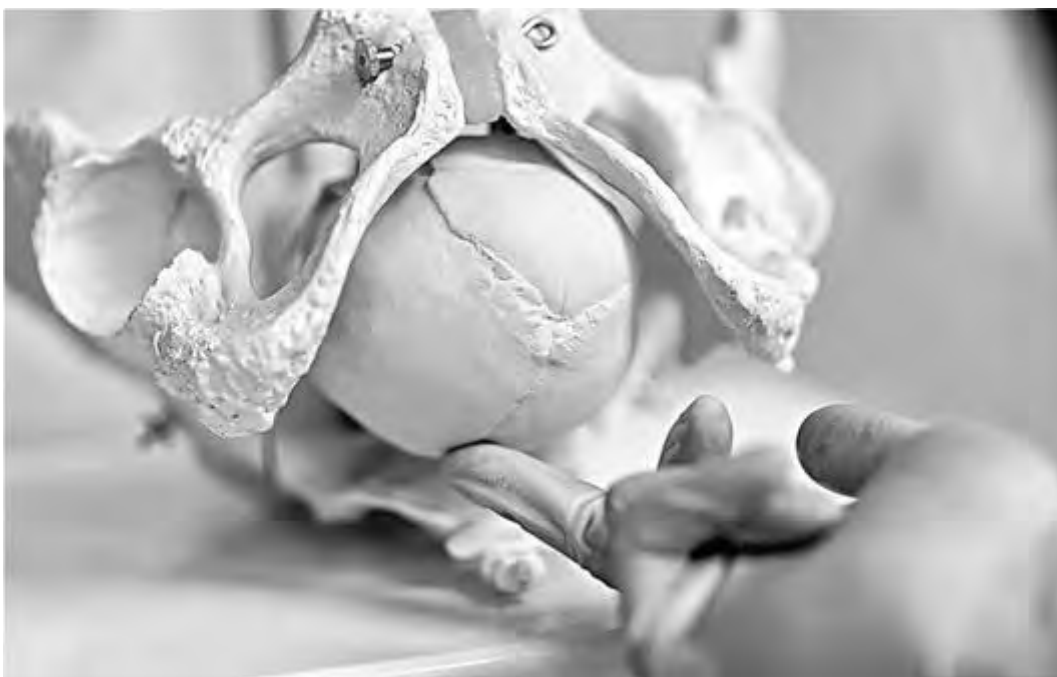
Рис. 51. Пальпаторное определение положения стреловидного шва при переднем виде