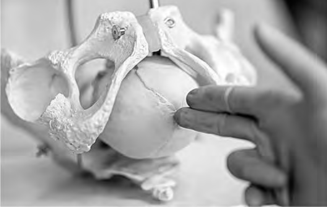
Рис. 46. Определение нижнего полюса предлежащей части, малого родничка