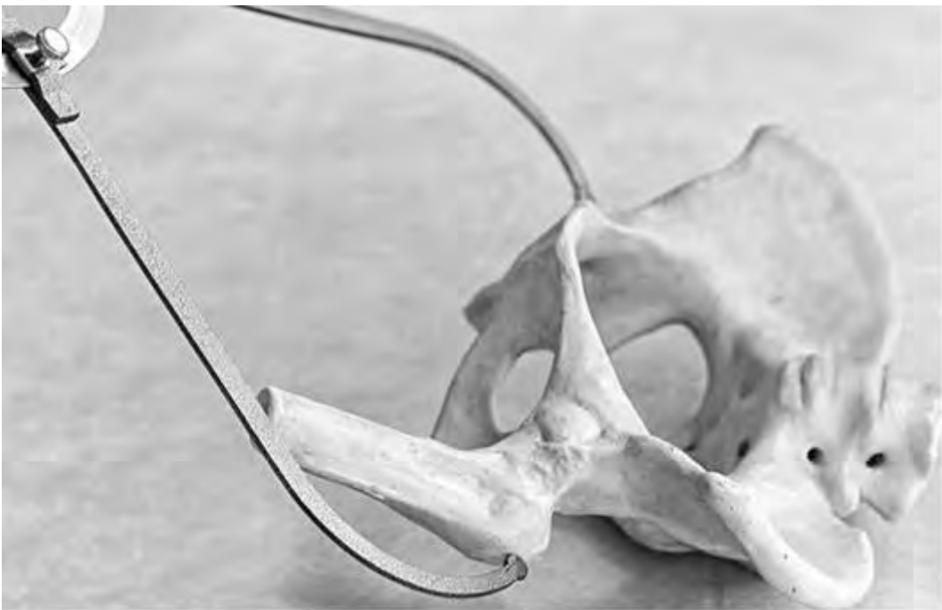
Рис. 17. Измерение distantia trochanterica - расстояния между большими вертелами бедренных костей