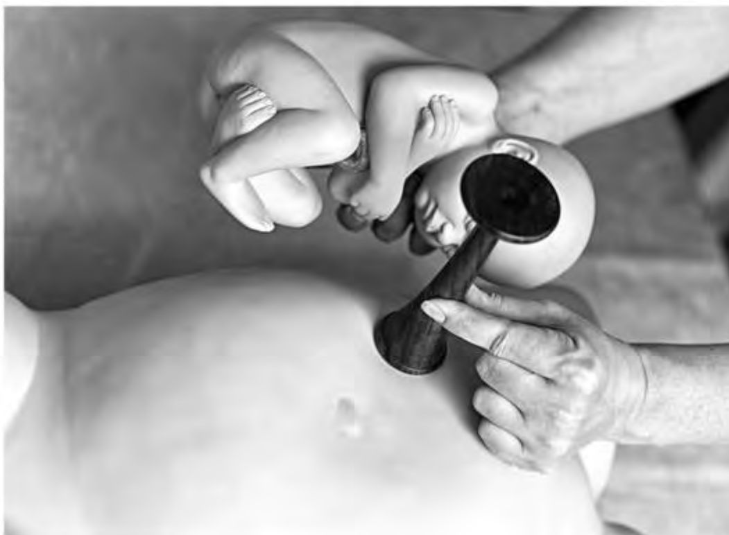
Рис. 35. Место наилучшего выслушивания сердцебиения плода при головном предлежании, первой позиции, переднем виде