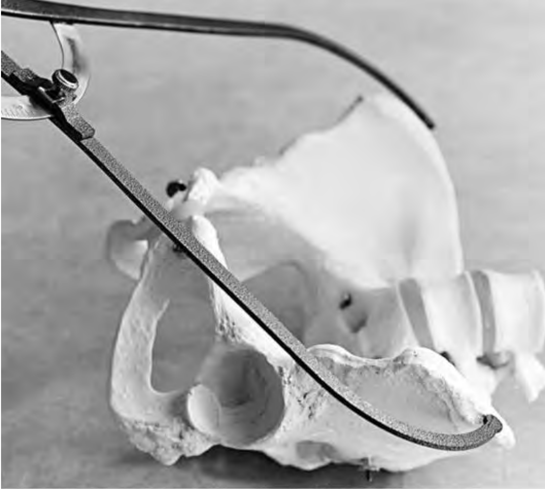
Рис. 16. Измерение distantia cristarum - расстояния между наиболее отдаленными участками гребней подвздошных костей