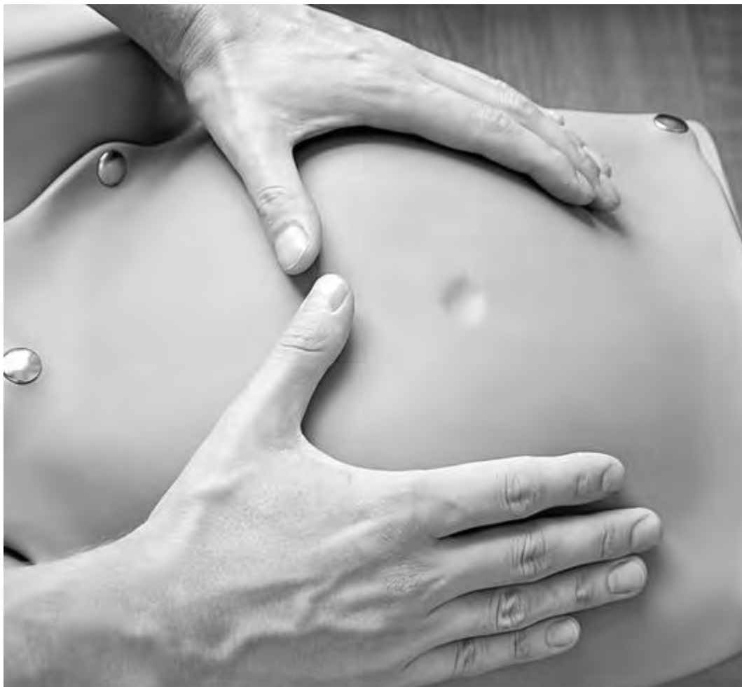
Рис. 30. Второй прием Леопольда-Левицкого. Определение положения, позиции и вида плода

С помощью второго приема Леопольда-Левицкого определяют положение, позицию и вид плода. Кисти рук сдвигаются со дна матки на боковые поверхности матки (приблизительно до уровня пупка). Ладонными поверхностями кистей рук производят пальпацию боковых отделов матки (рис. 30). Получив представление о расположении спинки и мелких частей плода, делают заключение о позиции плода. Если мелкие части плода пальпируются и справа, и слева, можно предположить двойню. Спинка плода определяется как гладкая, ровная, без выступов поверхность. При спинке, обращенной кзади (задний вид), мелкие части пальпируются более отчетливо. Установить вид плода при помощи этого приема в ряде случаев бывает сложно, а иногда и невозможно.