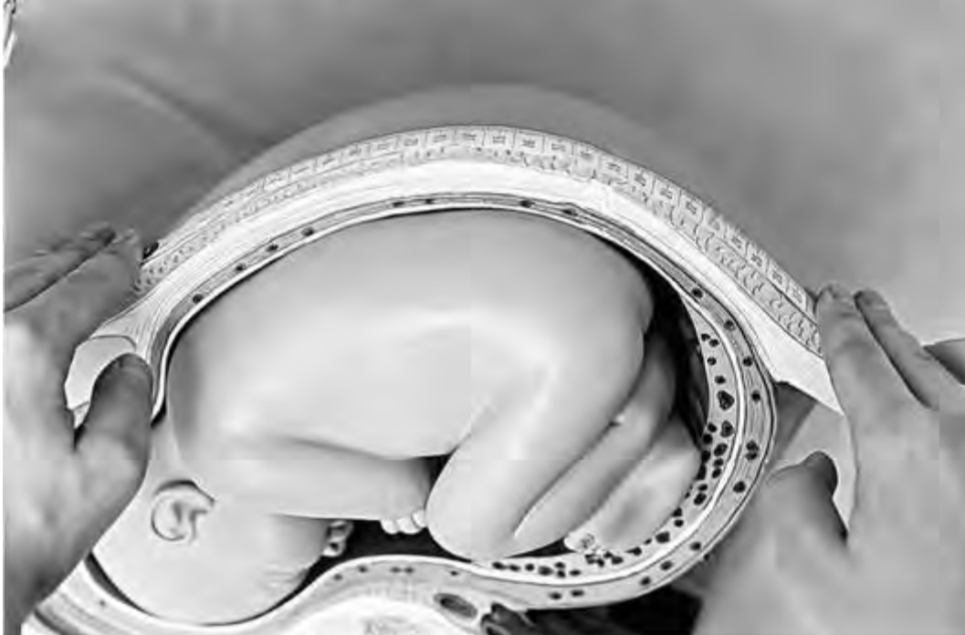
Рис. 38. Измерение длины полуокружности пальпируемого овоида плода