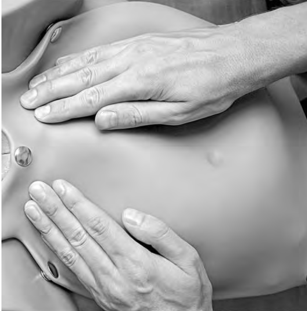
Рис. 32. Четвертый прием Леопольда-Левицкого. Определение характера предлежащей части и ее местоположения по отношению к плоскостям малого таза