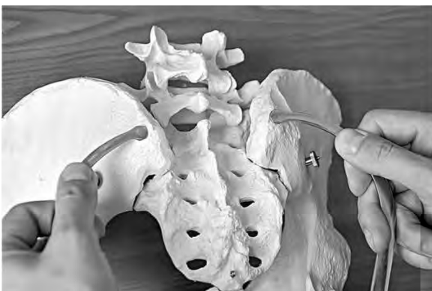
Рис. 25. Измерение тазомером расстояния между задними верхними подвздошными остями на примере костного таза

Для измерения и оценки формы ромба необходимо светлое помещение. Женщина должна находиться в положении стоя. Латеральные углы ромба хорошо контурируются в виде небольших округлых углублений непосредственно над задневерхними остями подвздошных костей. Верхний угол ромба соответствует углублению между остистыми отростками последнего поясничного и I крестцового позвонков, называемому надкрестцовой ямкой (рис. 35-36). Ромб не у всех хорошо выражен, поэтому для нахождения надкрестцовой ямки пользуются таким приемом: проводят горизонтальную линию, соединяющую верхние края гребней подвздошных костей ( crista ossis ilei ) обеих сторон; точка по средней линии, расположенная ниже проведенной линии на два поперечных пальца, и будет надкрестцовой ямкой. Нижний угол ромба - верхушка крестца - примерно соответствует началу ягодичной складки и легко определяется пальпаторно как наиболее выступающая кзади нижняя часть крестца. Измерения проводят либо тазомером, либо сантиметровой лентой (рис. 25-27).