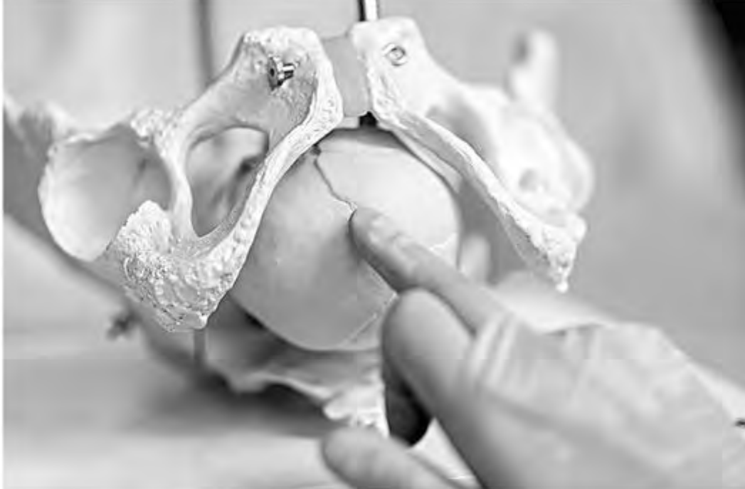
Рис. 48. Пальпаторное определение количества сторон (косточек), входящих в состав малого родничка при переднем виде