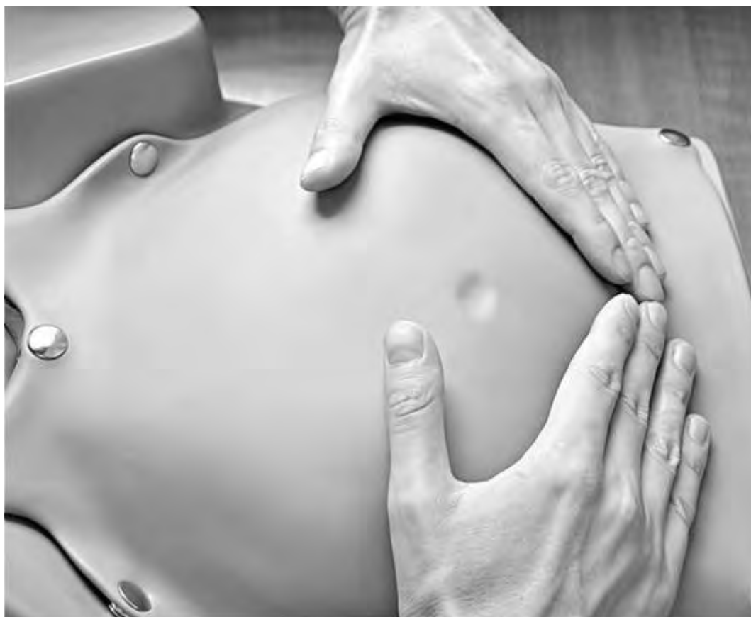
Рис. 29. Первый прием Леопольда-Левицкого. Пальпация части плода, расположенного в дне матки. Определение высоты стояния дна матки

Первым приемом определяют ВДМ и крупную часть плода, которая находится в дне матки . Ладони обеих рук располагаются на дне матки, концы пальцев рук направлены друг к другу, но не соприкасаются. Установив ВДМ по отношению к мечевидному отростку или пупку, определяют часть плода, находящуюся в дне матки. Тазовый конец определяется как крупная, мягковатая и не баллотирующая часть. Головка плода определяется как крупная, плотная и баллотирующая часть (рис. 29).