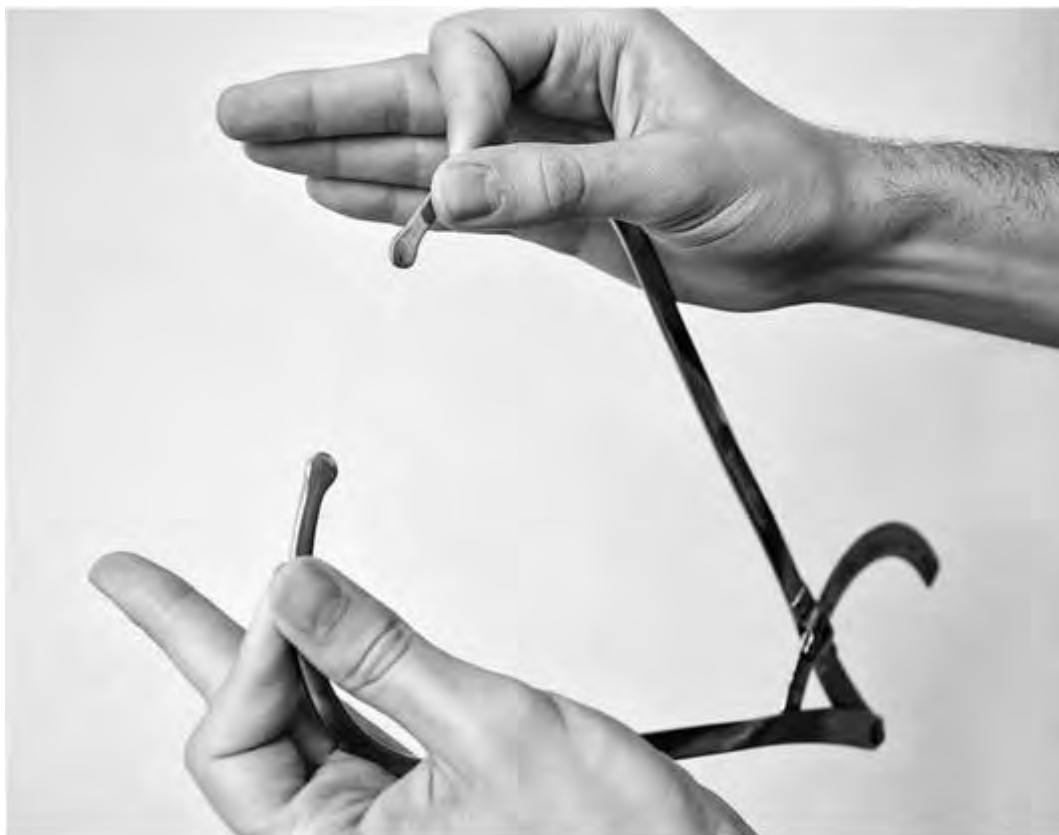
Рис. 11. Правильное положение тазомера в руках акушера. Врач обеими руками держит ножки тазомера, фиксируя их между большим и указательным пальцами