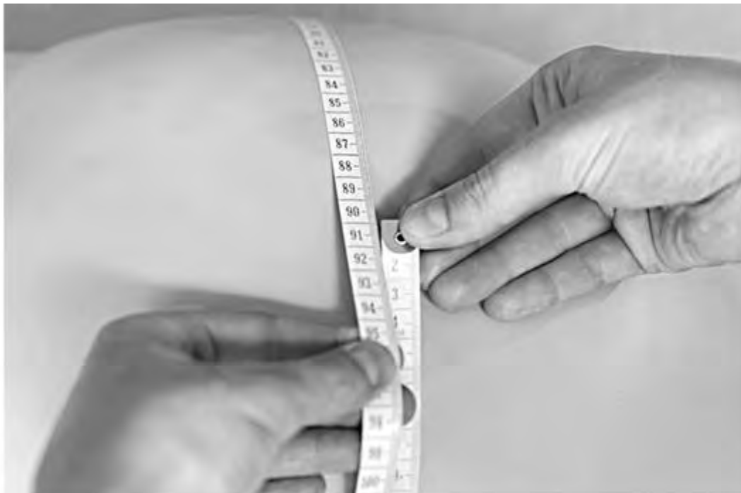
Рис. 3. Численное определение величины окружности живота

Для измерения ВДМ пациентка находится в том же положении. Важно, чтобы мочевой пузырь был опорожнен. Средним пальцем правой руки пропальпируйте середину верхнего внешнего края симфиза (рис. 4) и прижмите к нему нулевую отметку ленты (рис. 5).левой рукой разместите сантиметровую ленту строго по средней линии живота. Осторожно надавливая на живот, скользите левой рукой по направлению от симфиза к мечевидному отростку, ребром ладони левой руки фиксируйте дно матки (рис. 6). При этом сантиметровая лента находится