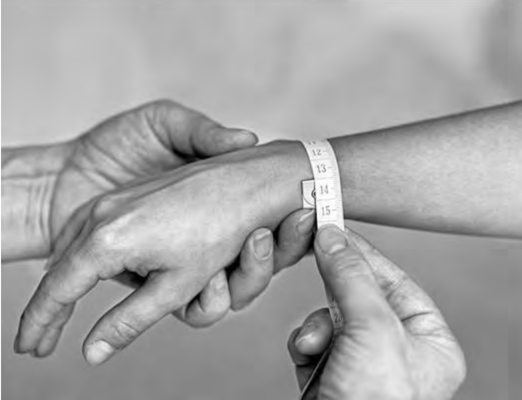
Рис. 28. Измерение индекса Соловьева