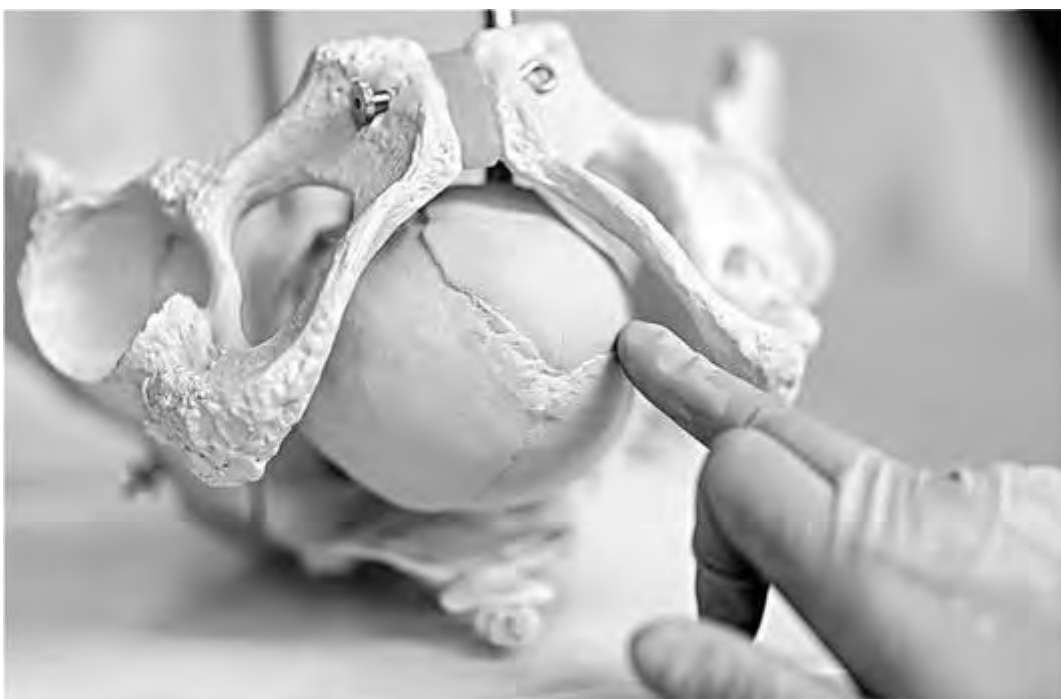
Рис. 49. Пальпаторное определение количества сторон (косточек), входящих в состав малого родничка при переднем виде