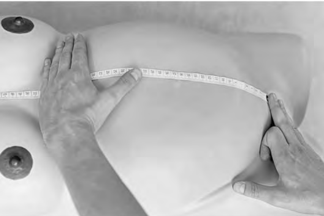
Рис. 7. Сантиметровая лента находится под ладонью левой руки