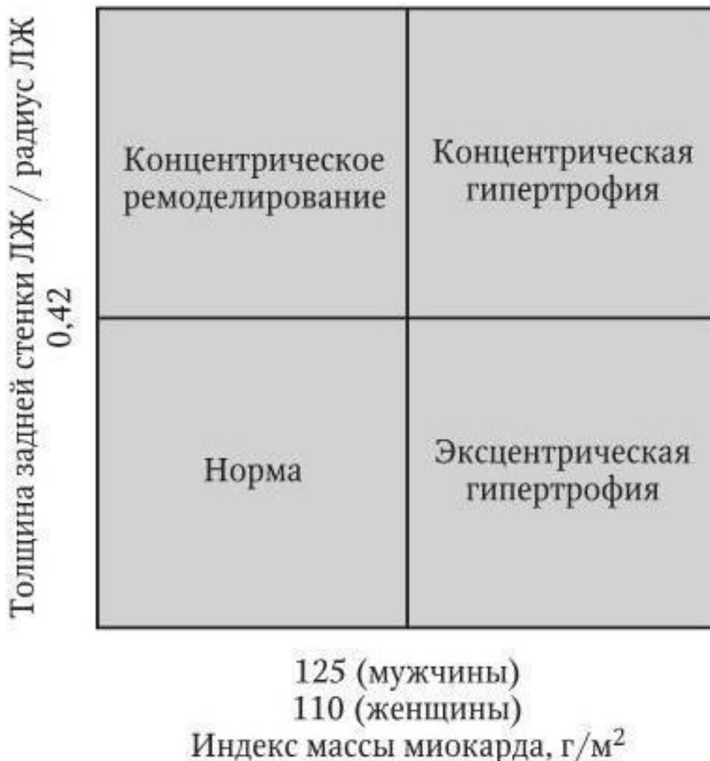
Рис. 1.2. Типы ремоделирования левого желудочка

нений придается снижению эластичности (повышению жесткости) крупных артерий, вследствие которого увеличивается скорость распространения пульсовой волны. Увеличение скорости распространения пульсовой волны на участке между сонной и бедренной артериями сопряжено с повышенным риском осложнений.