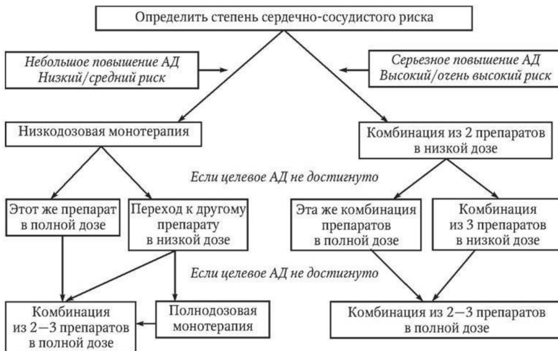
Рис. 1.3. Выбор стартовой терапии для достижения целевого уровня АД

Монотерапия в начале лечения рекомендуется пациентам с небольшим повышением АД и низким или средним риском сердечно-сосудистых осложнений. Комбинация двух препаратов в низких дозах предпочтительна для больных с АГ 2 – 3-й ст., высоким или очень высоким риском сердечно-сосудистых осложнений. В случае отсутствия желаемого результата у пациентов с низким или средним риском сердечно-сосудистых осложнений переходят к приему назначенного препарата в полной дозе или назначают другой препарат в низкой, а затем, при необходимости, в полной дозе и лишь на следующем этапе лечения применяют комбинированную фармакотерапию. У пациентов с высоким или очень высоким риском сердечно-сосудистых осложнений при неэффективности комбинации из 2 препаратов в низкой дозе переходят к полнодозовой комбинации тех же препаратов или дополнительно назначают третий препарат в низкой дозе. Если это усиление терапии не приводит к достижению целевого уровня АД, применяют полнодозовую комбинацию 2 – 3 препаратов. Пациентам с АД 3 160/100 мм рт. ст., имеющим высокий и очень высокий риск сердечно-сосудистых осложнений, комбинированная терапия двумя препаратами в полной дозе может быть назначена на старте лечения.